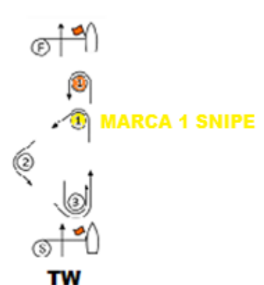
Largada – 1 - 2 - 3 – 1 - 3 – Chegada