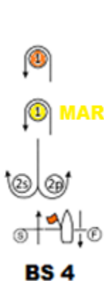
Largada – 1 - 2s/p – 1 – Chegada