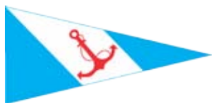
Yacht Club Argentino