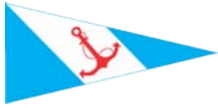
Yacht Club Argentino